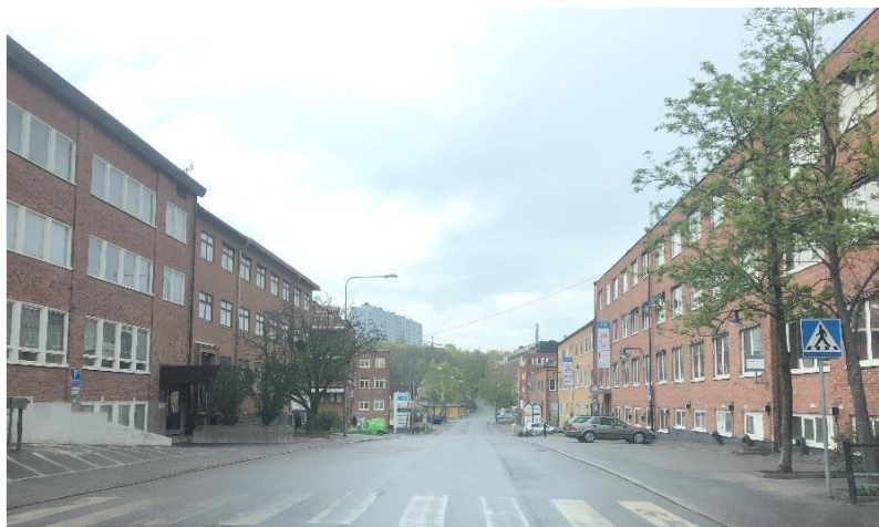
Industribebyggelse från 1940-talet utmed Industrigatan, vy norrut.