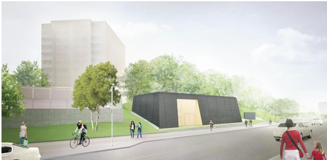
Föreslagen utformning av regionnätstationen (illustration & RUNDQUIST)

Den i planområdet intilliggande kulvertentrén kommer i samband med genomförandet av projektet att få en ny gestaltning som kommer att vara i likhet med gestaltningen av regionnätstationen. Kulvertentrén är med i planområdet pga att den delvis ligger inom nu gällande detaljplan (P0414/1970) vilket anger planbestämmelse Transformatorstation och delvis inom detaljplan (0404/1955) med användningen PARK. Genom att nu planlägga den del som har användningen Transformatorstation som PARK kommer hela kulvertentrén ligga inom samma fastighet (Järva 2:15) och med samma användning (PARK).