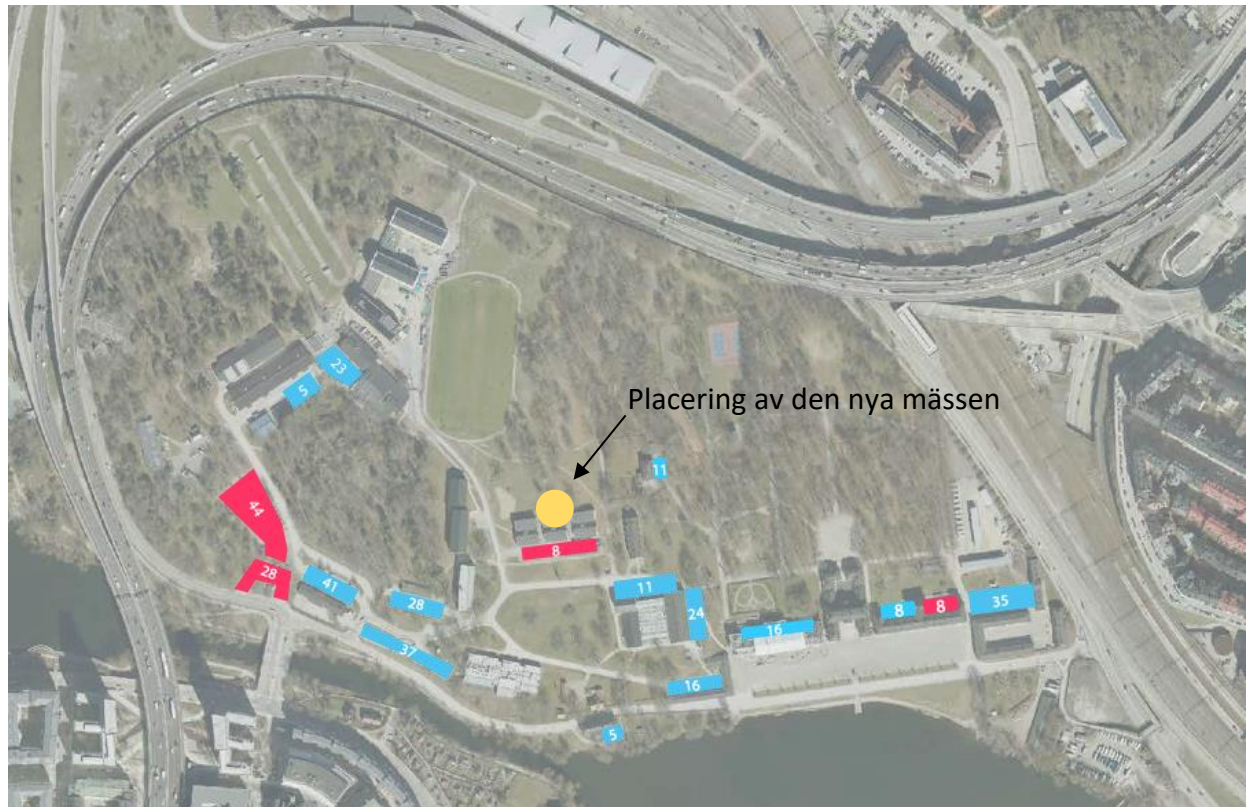
Figur 3: Befintliga och utgående (rödmarkerade) parkeringsplatser i området.

I dagsläget finns det omkring 120 cykelparkeringar utspritt på området. Bedömningen från den tidigare parkeringsutredningen är att det framtida cykelparkeringsbehovet kommer överstiga befintligt utbud. Likt bilparkering finns ingen cykelparkeringsnorm angiven för restaurang i Solnas parkeringsnorm. Ett rimligt cykelparkeringsantal bedöms vara 0,4 parkeringsplatser per anställd då det är ett campusområde och kadetter/övrig personal på Karlberg inte i en större utsträckning förväntas ta cykeln till mässen. Cykelparkeringsantalet motsvarar även angivet tal för kontor enligt parkeringsnormen. Således erhålls ett cykelparkeringsbehov på 10 platser. Dessa föreslås anläggas i anslutning till mässens två entréer och förses med möjlighet till ramlåsning (se markerade områden i Figur 1).