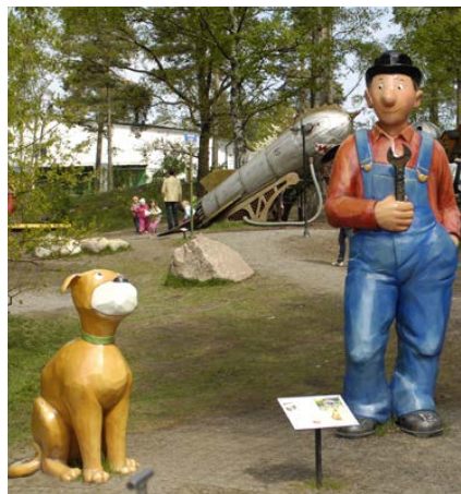
Mulle Meck parken i Järvastaden är ett populärt besöks- och utflyktsmål

Ett uppskattat inslag i stadsbilden är spegeldammsparken som kombinerar