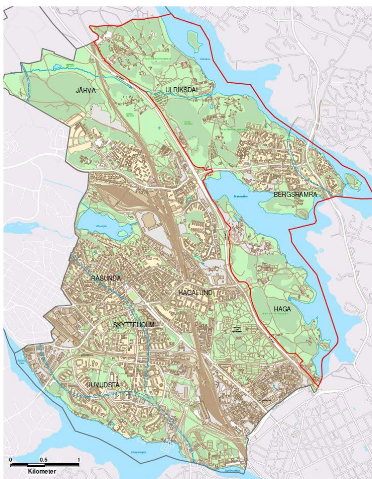
Nationalstadsparkens utbredning. Cirka en tredjedel av Nationalstadsparkens landareal ligger inom Solnas gränser (röd linje).